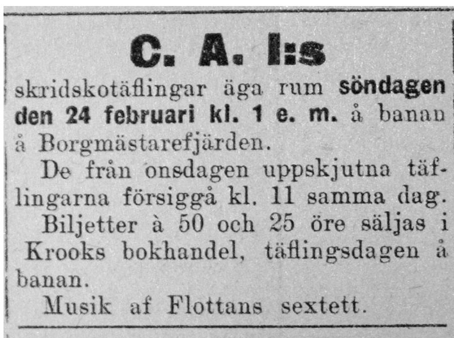
Ur BLT 23/2 1907

Carlskrona Allmänna Idrottsförening - den tidens KAIF - som då Kenth skrev dessa rader fortfarande var i livet – KAIF alltså, eller rättare sagt, jobbade järnhårt för att fortfarande ha sin och Lyckeby GoIF:s verksamhet med i föreningslivets topp som med dagens resultat FK Karlskrona – Fotbollsklubben Karlskrona – båda nått sina mål. Lycka till!