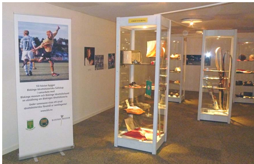
En klackspark från BIF och BFF.